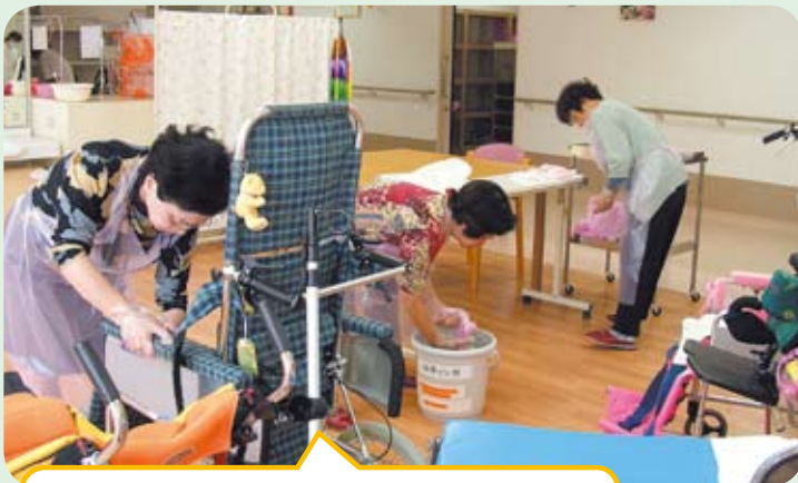
七尾婦人連合会による車椅子清掃の場面です。