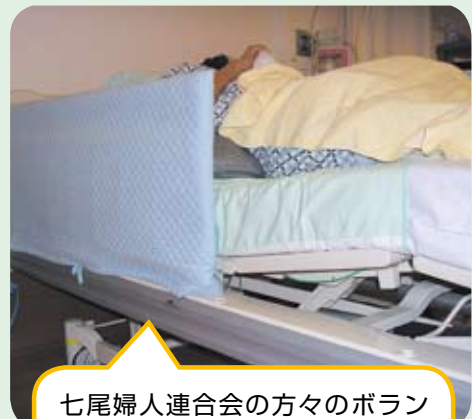
七尾婦人連合会の方々のボランティアリレーによって、きれいなベッド柵カバーができました。